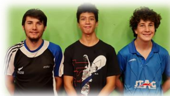
Et de jeunes Diplômés